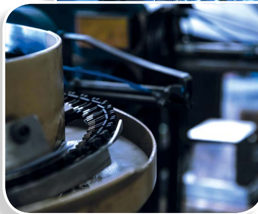
Für Europa werden die Produkte in Deutschland hergestellt.